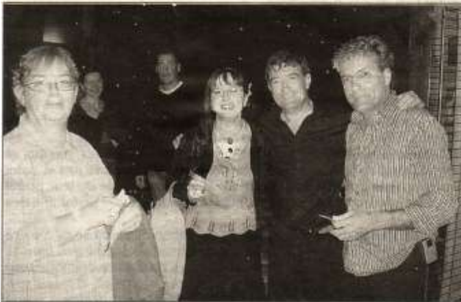
Après le spectacle, les auditeurs ont pu bavarder tranquillement avec les deux artistes.