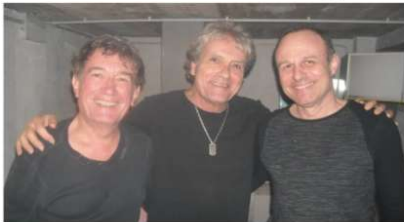
Le chanteur entouré de ses musiciens.