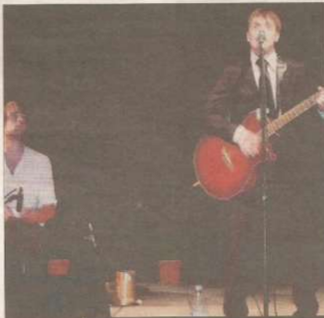
DÉCOUVERTE. jeudi soir