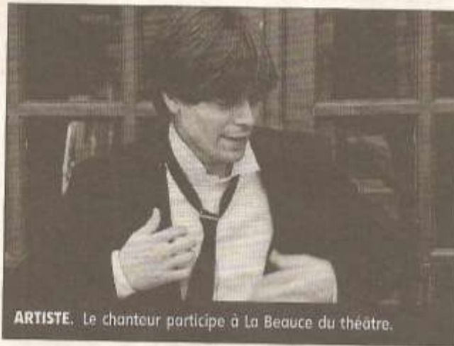
ARTISTE. Le chanteur participe à La Beauce du théâtre.